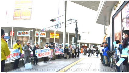
1/21 「大義なき、解散総選挙に審判を」アピール行動。

憲法共同センター・国民大運動実行委員会・広島県原水協の呼びかけで「大義なき自己都合解散に審判を、選挙に行つてこんな政治実現したい」の緊急宣伝アピール行動を1月21日に八丁堀交差点で行いました。緊急の行動にも関わらず40名が参加し、「大軍拡でなく、国民生活優先の政治を」と声を上げました。